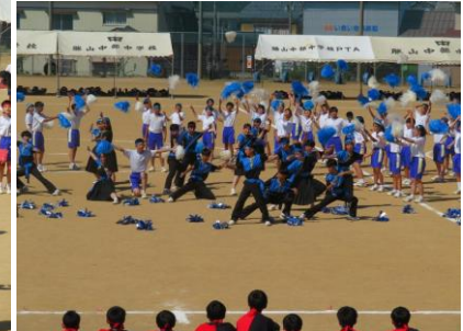
◆応援合戦、両チームともとってもステキでした(^-^)!