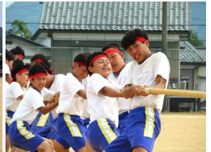
◆3年「マッスル玉入れ」、全校「綱引き」の様子。