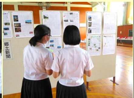
◆お化け屋敷にならぶ長蛇の列と、体育館展示コーナーの様子。皆さんのおかげで、とっても楽しい学校祭になりました(^_^)！