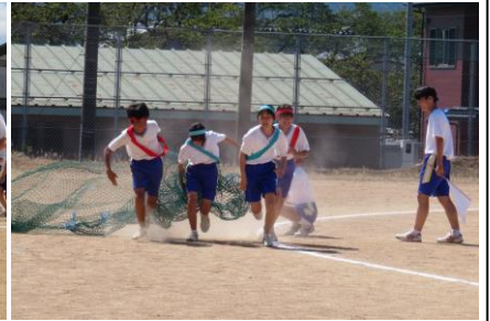
◆1年生「エッグ・ハンティング」、2年生「障害物競走」！