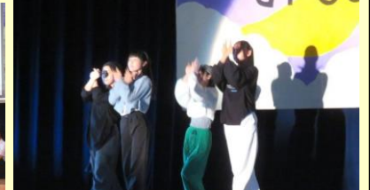
◆左は給食委員会、右はダンスパフォーマーたちの発表！ナイス！