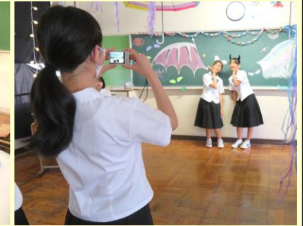
◆楽しいゲームコーナーや体験コーナーがいっぱい！