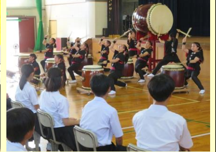
◆吹部の素晴らしい演奏と、勝高日本文化部の圧巻パフォーマンス。