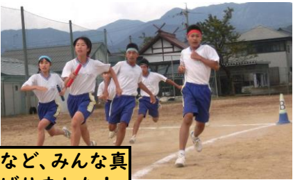
リレーや大なわなど、みんな真剣に楽しくがんばりました！